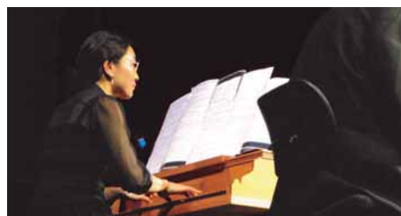
Auch ein Cembalo kam zum Einsatz