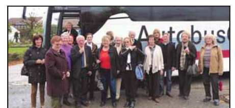
Der Opernclub München war eigens mit einem Bus angereist

Kontakt: Tel. 07237/422-0 Fax: 07237/422-33 Email: info@gottlob-frick-gesellschaft.de Internet: www.gottlob-frick-gesellschaft.de