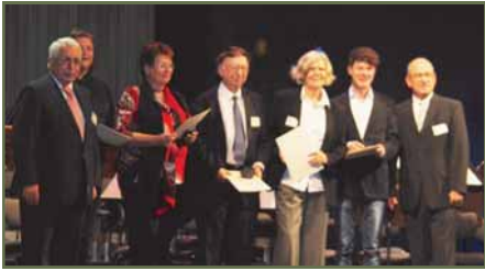
Verleihung der Gottlob-Frick-Medaille an erstmalige Gäste