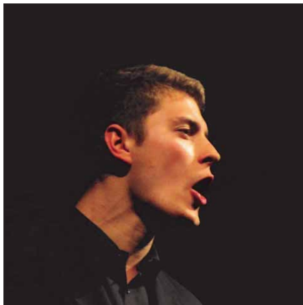
Jakub Józef Orłinski